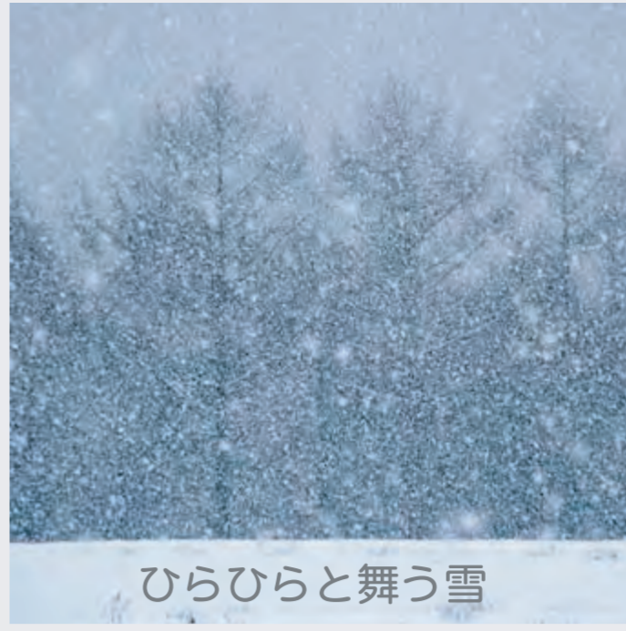
ひらひらと舞う雪