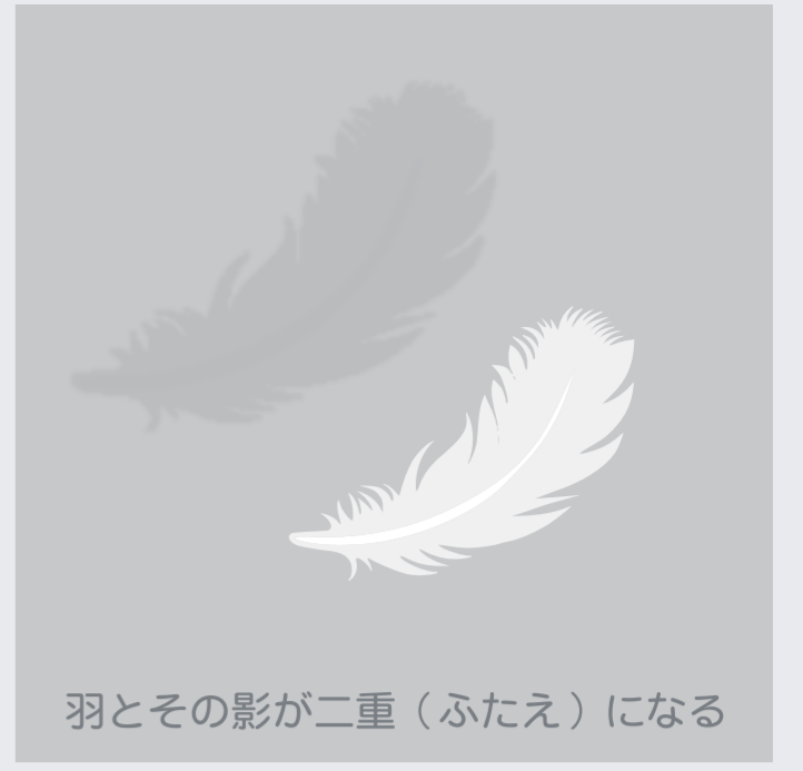
羽とその影が二重 (ふたえ) になる